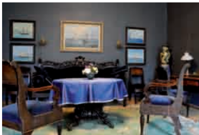
Sagadin kartanon sininen huone.

aikanaan Viron suurin, sen sijaan koki kovia venäläisten asuttamana. Lähes 50 vuoden tuhoamisvimma on jättänyt surua herättävät jäljet aikanaan niin komeaan kartanoon. Ei voi kuin toivoa, että jostain löytyisi varat sen korjaamiseen.