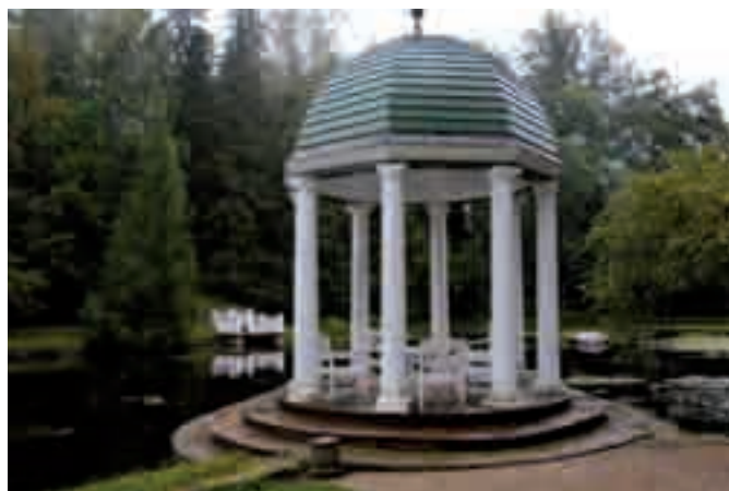
Palmsen kartanon huvimaja.

10 vuodessa Tallinna on kehittänyt ja kaunistunut valtavasti, mutta Koplia, ennen kalastajien ja merimiesten asuttamaa kaupunginosaa, sivistys ei ole saavuttanut.